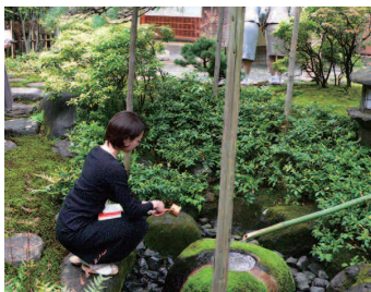
文化教養講座 (裏千家東京道場コース)

協会の幅広いネットワークを駆使し、 斯界の第一人者から直接指導を受ける ことで、基本を身につけ、さらに品格 を養うことを目的とします。一般の方 も受講できますが、インストラクター や講師としてマナー指導に関わる方 には必須のコースです。