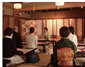
和の作法講座 (基礎・上級)