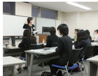
ビジネスマナー講座 (基礎・上級)