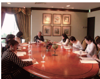
テーブルマナー講座 (基礎・上級)