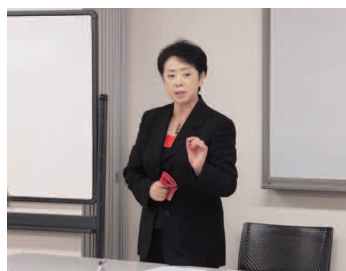
話し方講座 (基礎・上級)